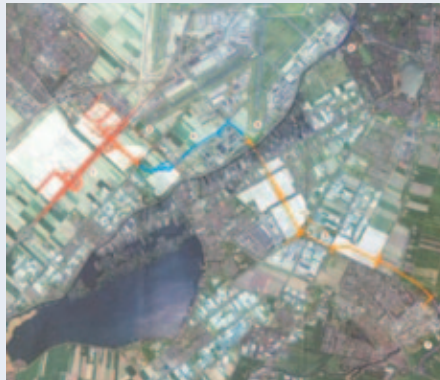
“Geplande traject N201 langs Schiphol”

In het SADC werken drie overheden (Provincie Noord-Holland, Gemeente Amsterdam, Gemeente Haarlemmermeer) en Schiphol Group samen op basis van gelijkheid. Door deze samenwerking blijft de Ruimtelijk Ordening beter invul-